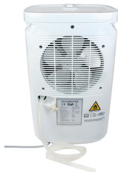
Option évacuation directe des condensats