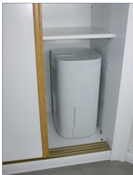
Faible encombrement... Facile à ranger dans un placard !