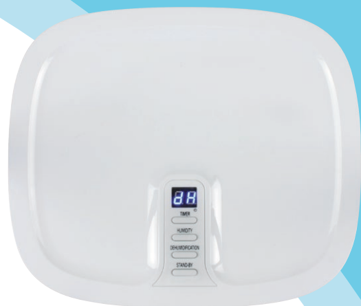
Panneau de commandes