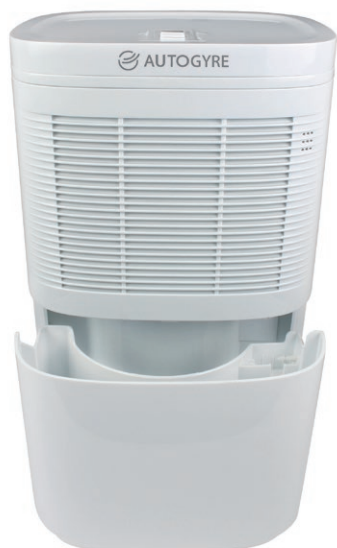
Réservoir 2,2 l